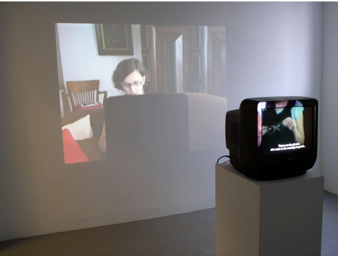
She has her own story to tell 彼女には彼女自身の語るべき物語がある