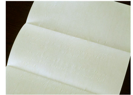
(左頁) 手紙を読む観客 (右頁、時計回り) 展示会場の地図と構成; 机の上の凸版印刷された手紙; 透明の壁の向こう側から見たインスタレーション風景; パフォーマンスへと転じた一観客、それを見つめる他の観客がガラスに映る

アムステルダム中心で運河沿いの家に住み、その巨大な窓を通して街路樹の緑や陽光を楽しむ一方で、日が暮れて明かりを点すと、家での生活が舞台上上げられたかのように感じられた。