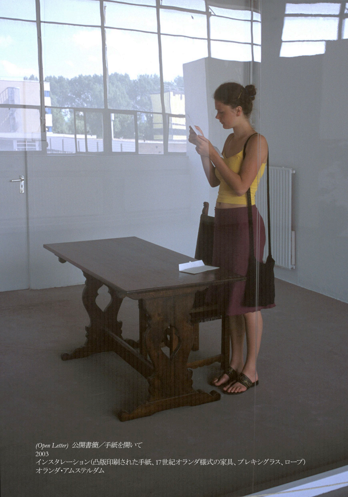
(Open Letter) 公開書簡／手紙を開いて